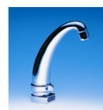
AUM3E Art.Nr. 66173