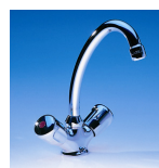
SNM Art.Nr. 04200