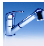
EKA Art.Nr. 04230