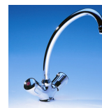
SKM Art.Nr. 04210