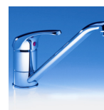
EKM Art.Nr. 04220