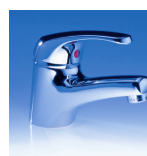
ENM Art.Nr. 04240